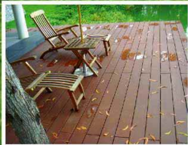
ลา구나 ภูเก็ต