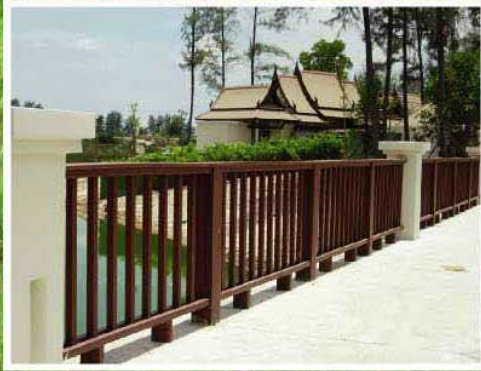
ลางูน่า ภูเก็ต