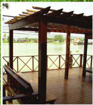
ศาลาริมน้ำ ปทุมธานี