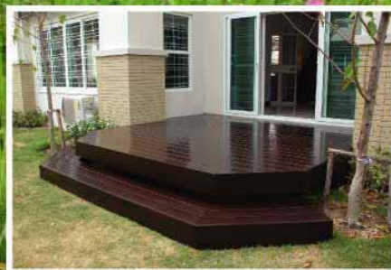
หมู่บ้านกฤษณา