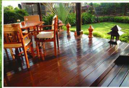
หมู่บ้านวิจิตรธานี