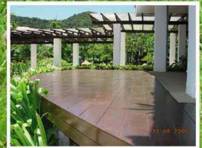
อ่าวบาง วิลล่า รีสอร์ท