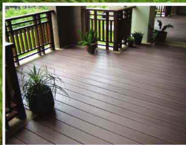
หมู่บ้านเศรษฐี สุขภิบาล