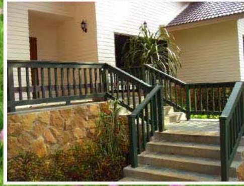
วิลล่าปาร์ค เขาใหญ่